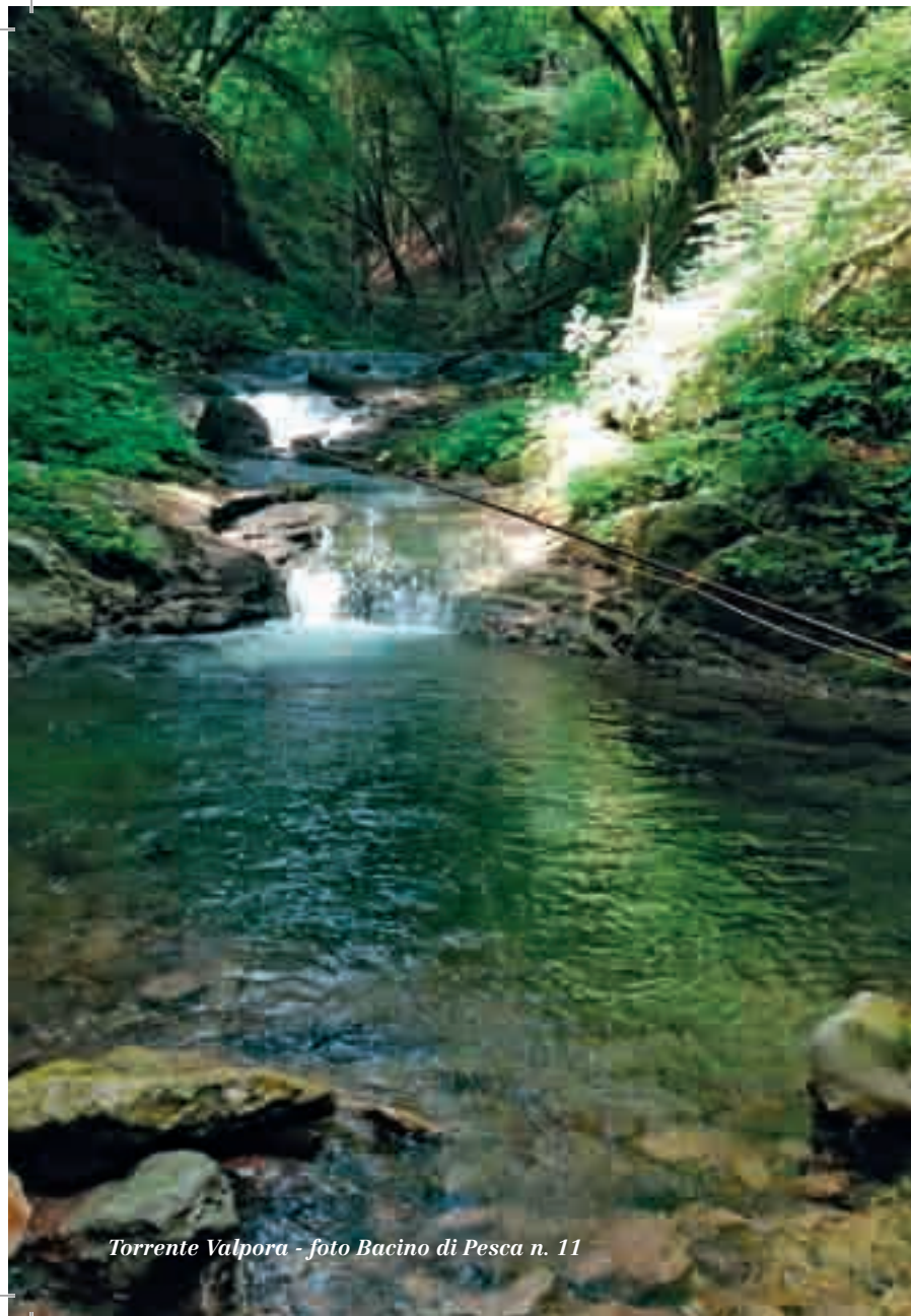
Torrente Valpora - foto Bacino di Pesca n. 11