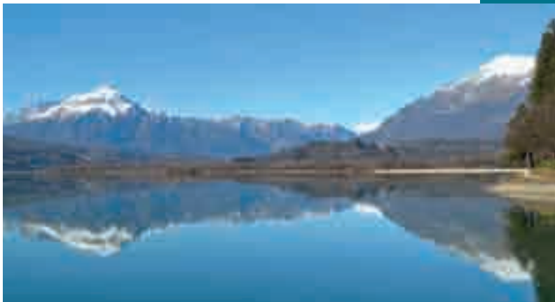
Lago di Santa Croce - Bacino di Pesca n. 7.

Tutte le acque fluenti e lacustri della provincia di Belluno, esclusi i laghi di Santa Croce e di Corlo, sono classificate salmonicole (zona "A"). I laghi di Santa Croce e di Corlo sono classificati zona ciprinicola (zona "B").